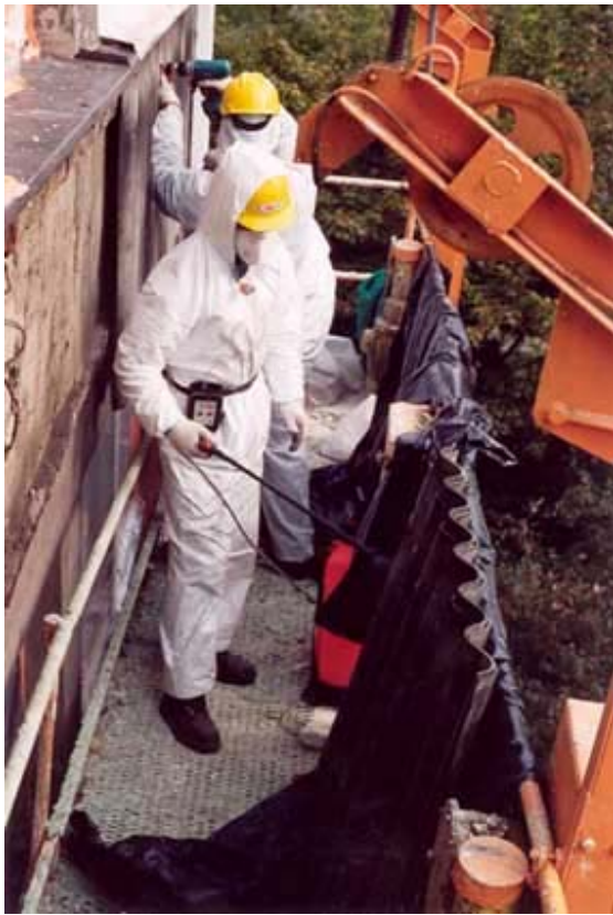
Rysunek 3 Usuwanie wyrobów azbestowych:

Poniżej przedstawiono sposób prawidłowego postępowania przy usuwaniu, demontażu i rozbiórce elementów azbestowych