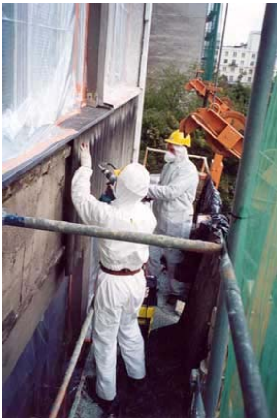
Rysunek 4 Przygotowanie wyrobów azbestowych do transportu: