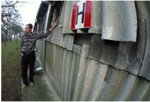
Rysunek 7 Znaczne uszkodzenia powierzchni azbestowych płyt falistych na dachu budynku: