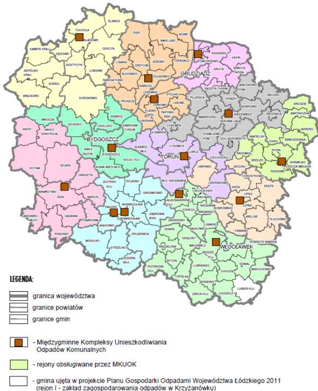
Rys. 6. Projektowany podział województwa na poszczególne Międzygminne Kompleksy Unieszkodliwiania Odpadów (MKUOK)

Miasto Rypin wraz z pozostałymi Gminami Powiatu Rypińskiego stworzyło związek Gmin Rypińskich. W skład związku wchodziły gminy Bzurze, Rogowo, Skrwilno, Wapielsk, Rypin i Miasto Rypin. Związek 1 lipca 2007r. wszedł wraz z całym majątkiem do Regionalnego Zakładu Utylizacji Odpadów w Puszczy Miejskiej.